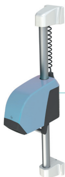
REF 8 22 1406 Sèche-cheveux Neptune bleu