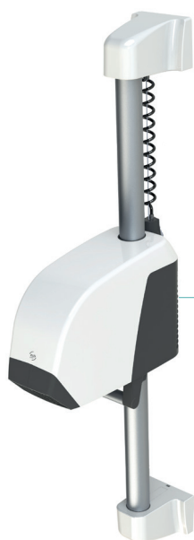
REF 8 22 1405 Sèche-cheveux Neptune blanc