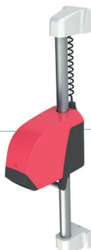
REF 8 22 1407 Sèche-cheveux Neptune rouge

Sèche-mains pour piscines et salles de sport, résistant en atmosphère chlorée et pourvu d'un moteur à induction pour une utilisation intensive. Hauteur réglable et ergonomique (rotation à 180°). Garantie 3 ans pièces et main d'oeuvre.